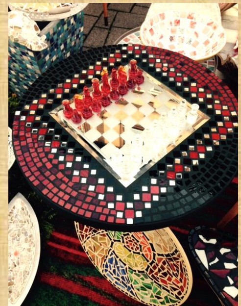
Auf ausgewählten Märkten