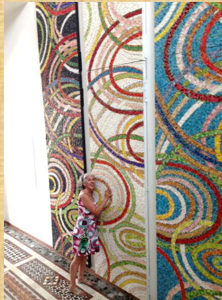
Zu Besuch in Spilimbergo