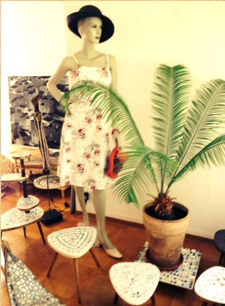
Im Atelier in Reutlingen